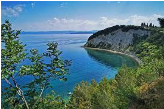
Landscape park Strunjan

51% of nature is protected in the destination